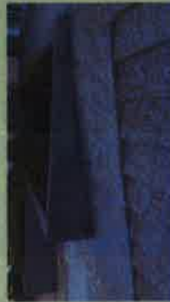
nowa nawierzchnia wraz z pochylnią