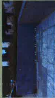
stojaki na rowery