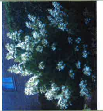
okazale krzewy hortensji