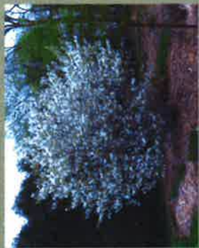
duży krzew/małe drzewko - świdosiłwa